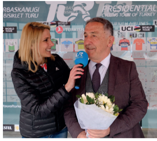
Erol Küçükbakırcı Türkiye Bisiklet Federasyonu Başkanı President of Turkish Cycling Federation