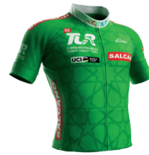
Yeşil Mayo Green Jersey Sam Bennett BORA - Hansgrohe