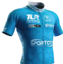
Turkuaz Mayo Turquoise Jersey Sam Bennett Bora Hansgrohe