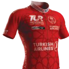
Kırmızı Mayo Red Jersey Beat Txoperena Euskadi - Murias