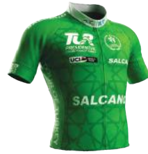
Yeşil Mayo Green Jersey Sam Bennett Bora Hansgrohe