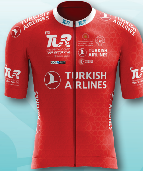
Kırmızı / Red En İyi Tırmanışçı King of the Mountain