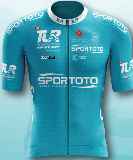
Turkuaz / Turquoise Genel Klasman General Classification