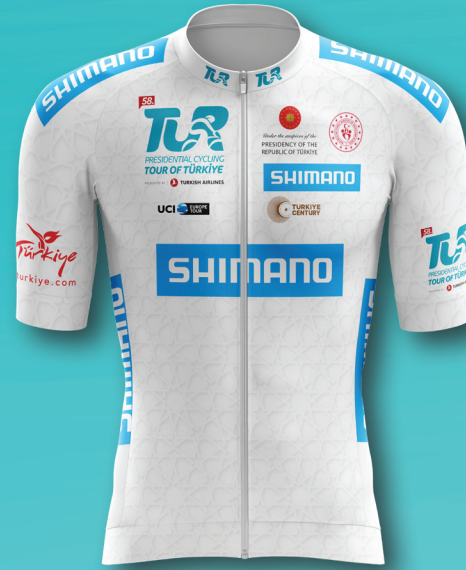
Beyaz / White Türkiye Güzellikleri Sprint Primleri Lideri Treasures of Türkiye Sprint Points Leader