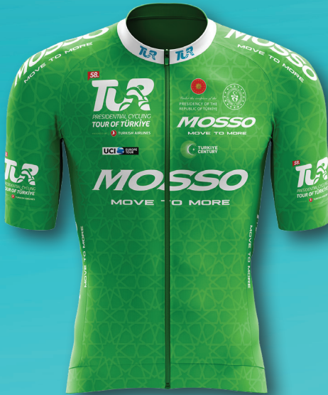
Yeşil / Green En İyi Sprinter The Best Sprinter