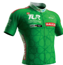
Yeşil Mayo Green Jersey Sam Bennett BORA - Hansgrohe