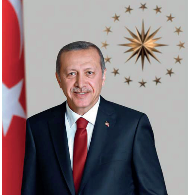
Recep Tayyip ERDOĞAN Türkiye Cumhurbaşkanı / President of Turkey

Spor, insanları bir araya getiren, farklı kültürleri buluşturan, rekabetle birlikte dayanışmayı, kaynaşmayı da artıran evrensel bir faaliyettir.