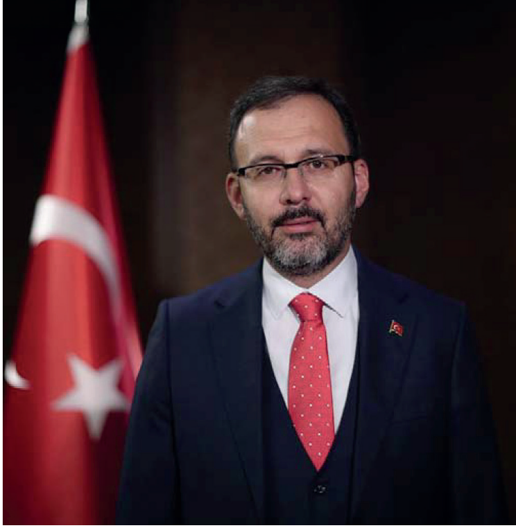
Dr. Mehmet Muharrem KASAPOĞLU Türkiye Cumhuriyeti Gençlik ve Spor Bakanı Youth and Sports Minister of the Republic of Turkey