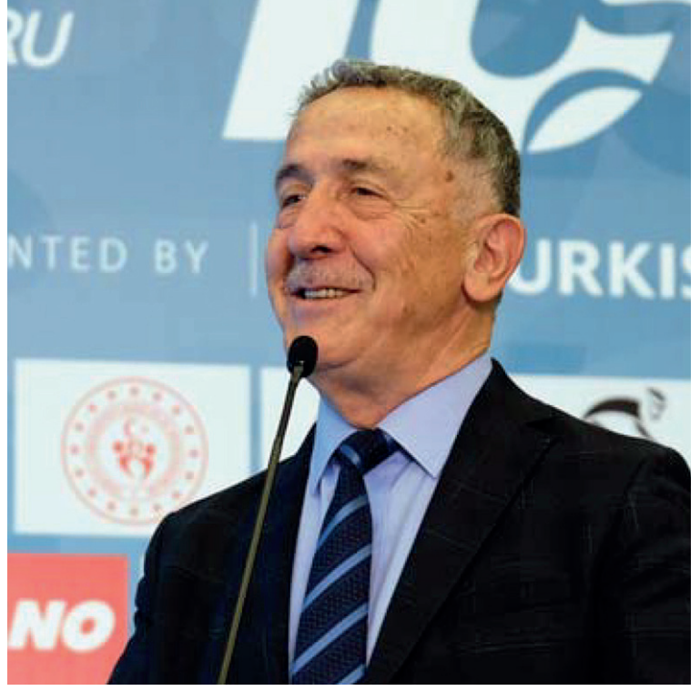
Erol KÜÇÜKBAKIRCI Türkiye Bisiklet Federasyonu Başkanı President of Turkish Cycling Federation

Cycling is in fact a lifestyle immersed in nature, allowing you to feel the breeze in your face, and experience pleasure and anguish at the same time.