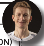
ANDRÉ GREIPEL (ISRAEL START-UP NATION) SPRINTER - SPRINTER 75KG 1.84M