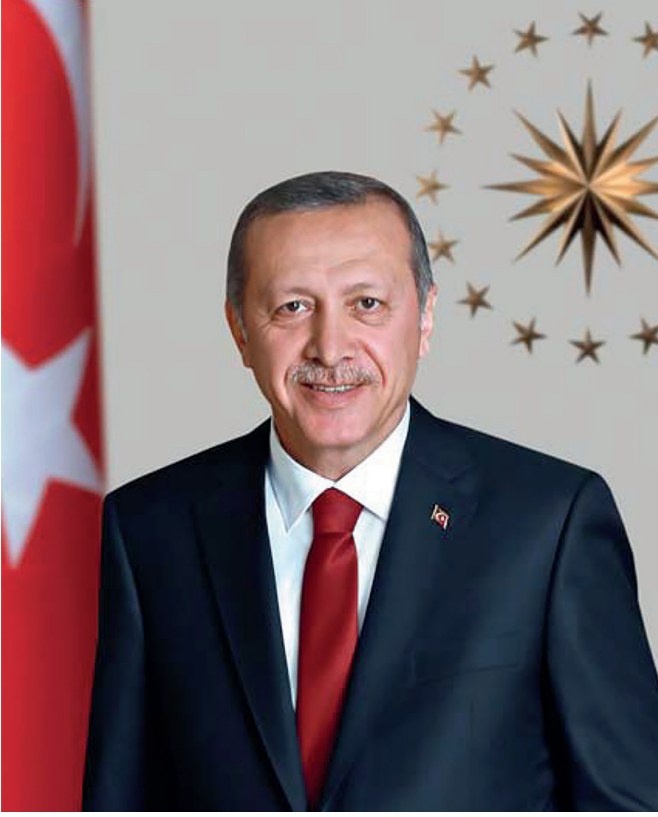
Recep Tayyip ERDOĞAN Türkiye Cumhurbaşkanı / President of Turkey

Cumhurbaşkanlığı himayelerinde gerçekleştirilen Cumhurbaşkanlığı Türkiye Bisiklet Turu farklı renklerden, farklı inançlardan, farklı kültürlerden insanları bir araya getirerek kültür mozaiğine büyük katkılar sunmaya devam ediyor.