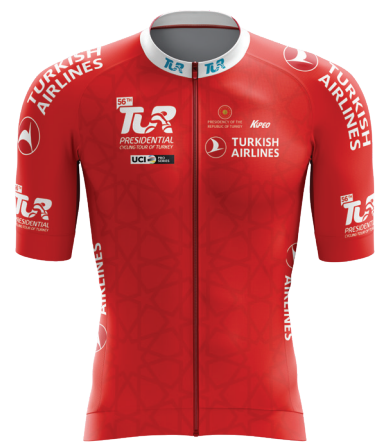
Kırmızı mayo Red jersey