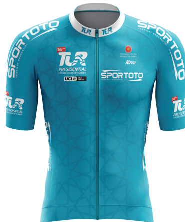
Turkuaz mayo Turquoise jersey

Official classifications of TOUR - Stage 7