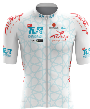
Beyaz mayo White jersey