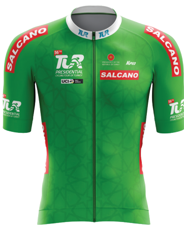
Yeşil mayo Green jersey

Here, on the same day, you can visit special places and enjoy the Aegean Sea. You can relieve the sweet tiredness of this 8-day busy route with the famous fruit wines you choose from Şirince. 🍷