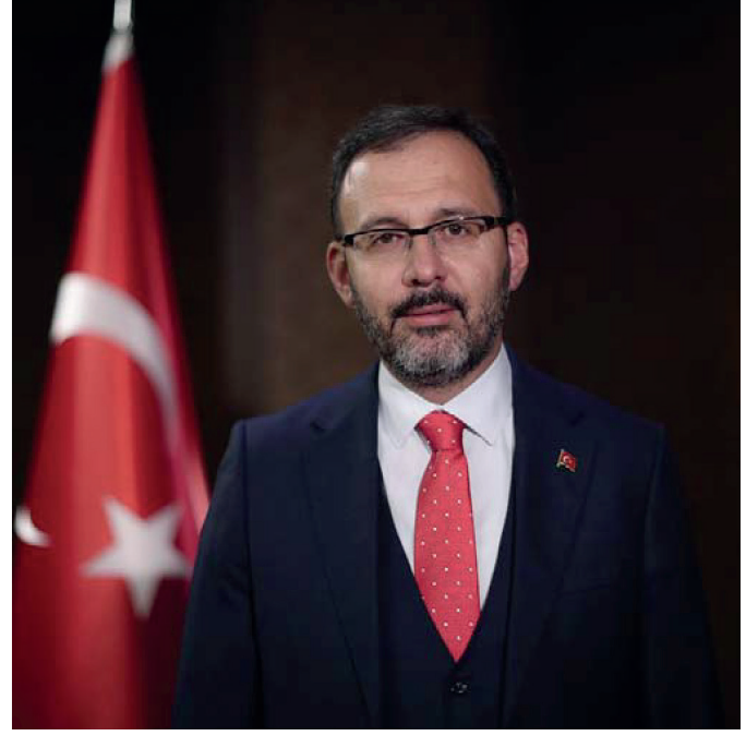
Dr. Mehmet Muharrem KASAPOĞLU Türkiye Cumhuriyeti Gençlik ve Spor Bakanı Youth and Sports Minister of the Republic of Turkey

I congratulate all the athletes, teams and country representatives who participated in this important sports organization held under presidential auspices, and I wish them success in the future. I would like to express my heartfelt gratitude to all our institutions that took part in the organization at the Presidential Cycling Tour of Turkey for their efforts. ❀