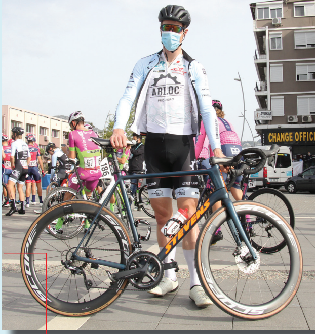
IVAR SLIK ABLOC

Stevens Xenon Ultegra / Scope R5 Disk +20TL / 7.7KG