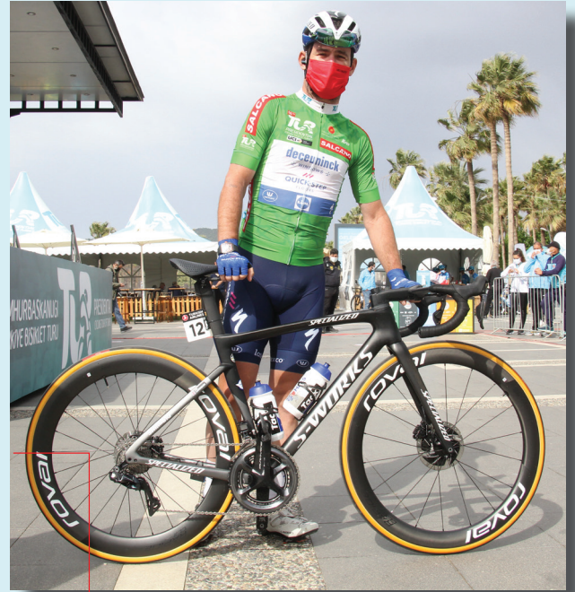
MARK CAVENDISH DECEUNINCK-QUICKSTEP

Look 785 Huez RS Sram Red eTap AXS / Corima WS 47 +80TL / 7KG